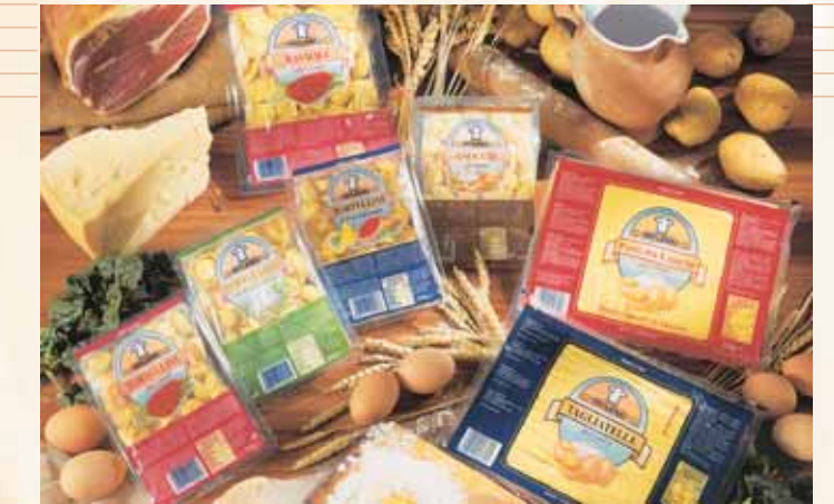
LINEA "TRADIZIONALE" Ligne "traditionelle" "Traditional" range Línea "tradicional"