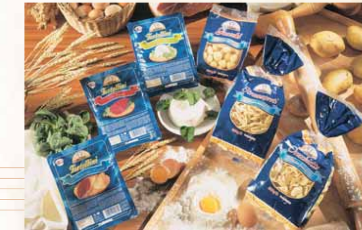
LINEA "SFOGLIA SOTTILE" E "PASTE SPECIALI" Ligne "Cuisson vite" et "Pâtes spéciales" "Short cooking" and "Special pasta" range Línea "Masa delgada" y "Pasta especial"